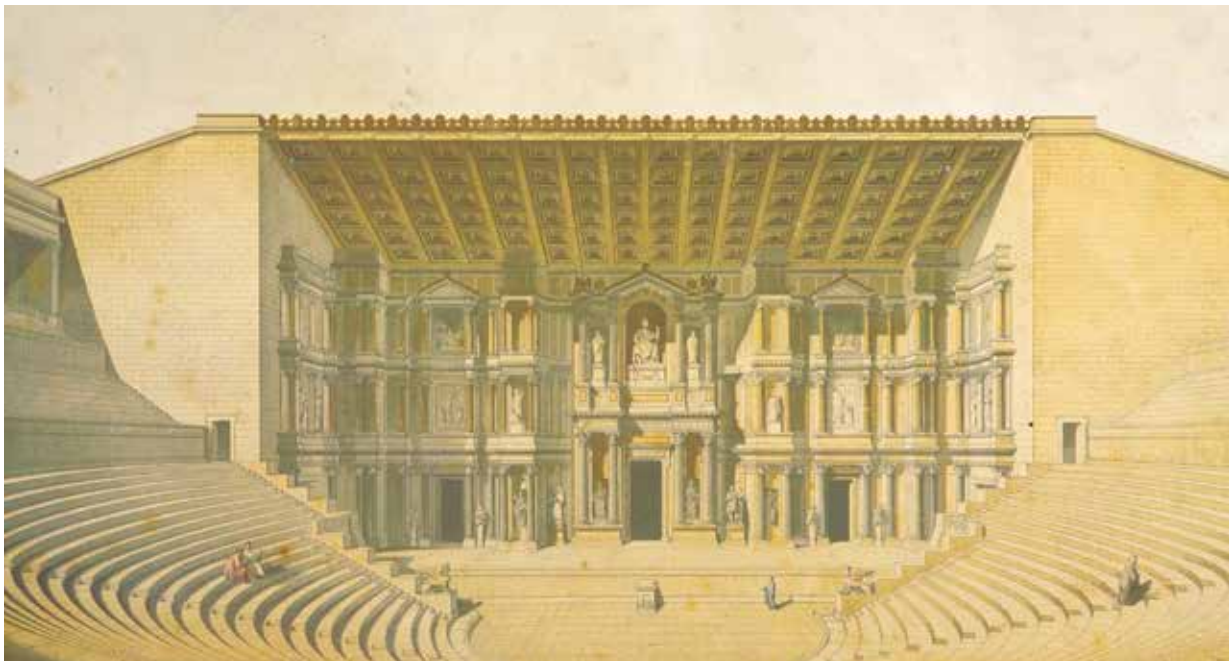
Dessin du XIX e siècle reconstituant le Théâtre d'Orange dans l'Antiquité.