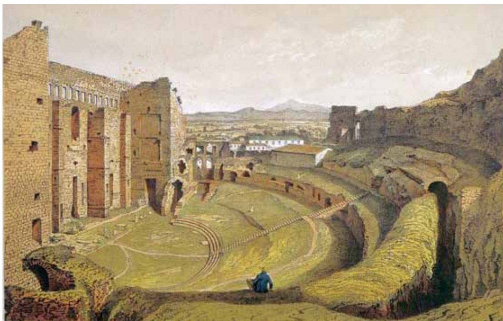
Ruines du Théâtre romain à Orange au XVIII e siècle.