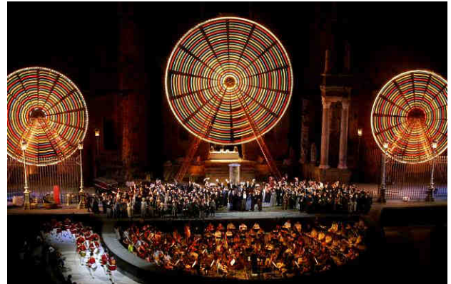
2005, La Bohème de Giacomo PUCCINI Chef d'orchestre : Jésus Lopez-Cobos Metteur en scène : Nicolas Joel