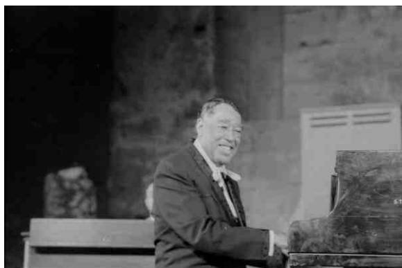
Duke Ellington, Jazz-Chorégies de 1972

En 1983, Fats Domino se produit pour les dernières Jazz Chorégies. Année où malheureusement le festival devra s'interrompre par manque de moyens financiers.