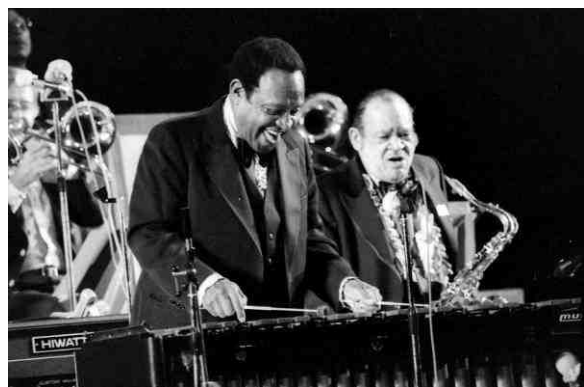
Lionel Hampton, Jazz-Chorégies de 1979