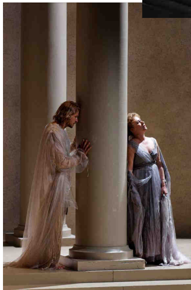
A gauche : Madeleine Roch, sociétaire de la Comédie-Française 1910