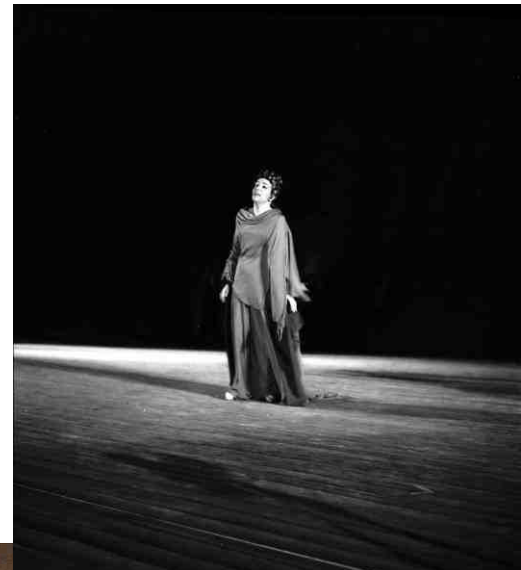
1963, Iphigénie à Aulis d'Euripide par la Comédie-Française