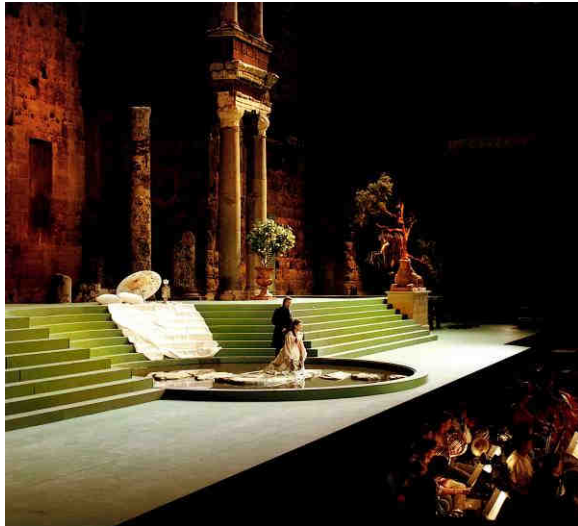
1993, La Traviata de Giuseppe VERDI Chef d'orchestre : Michel Plasson Metteur en scène : Francesca Zambello